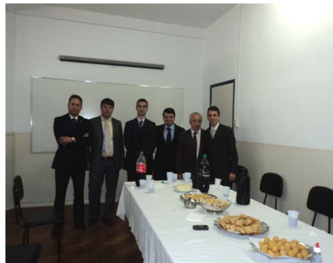
Confraternização dos professores no intervalo das apresentações das monografias